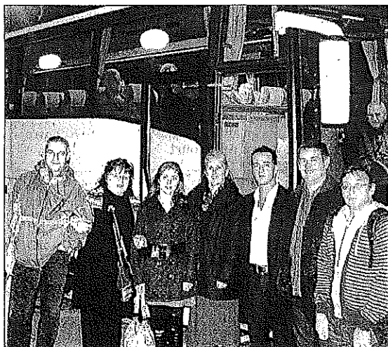
Dans une bonne ambiance.

A l'initiative de la MJC, c'est plus d'une quarantaine de Marbichons qui se sont rendus au Royal Palace de Kirrwiller. Interpellés sur le départ du bus, les frileux passagers ne se sont guère prêtés à la photographie de départ ! Après une escale à Ludres, et deux heures de voyage dans une ambiance propre aux Marbichons, la soirée